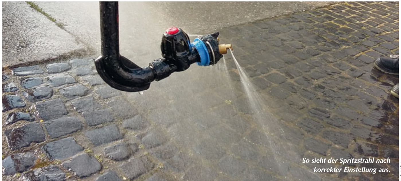
So sieht der Spritzstrahl nach korrekter Einstellung aus.