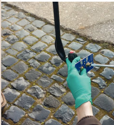
Droplegdüsen werden mit einer Schablone exakt eingestellt.